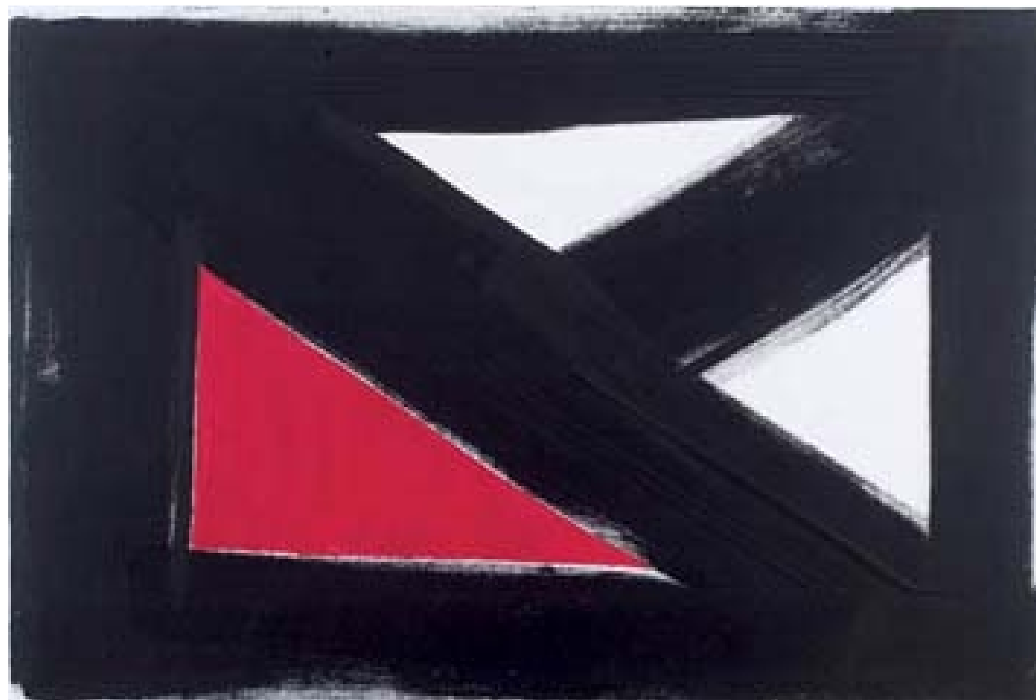
AMILCAR DE CASTRO Sem Título, 1993